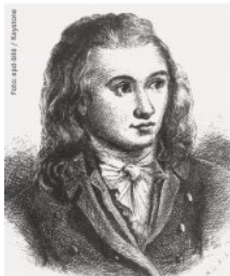
Der Dichter Novalis, eigentlich Friedrich Freiherr von Hardenberg (1772–1801)

VOR 225 JAHREN STARB DER DICHTER NOVALIS